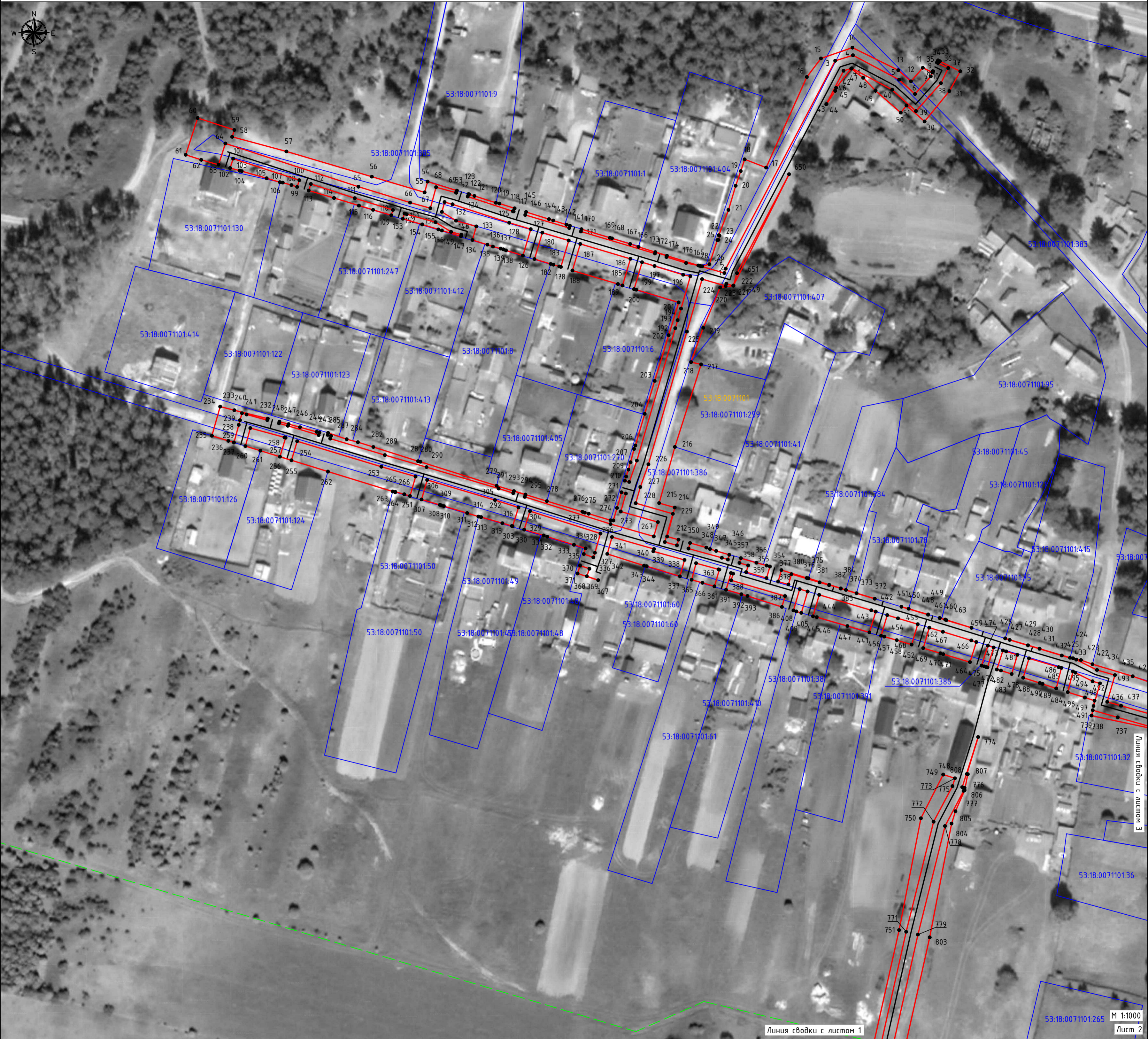
СХЕМА РАСПОЛОЖЕНИЯ ГРАНИЦ ПУБЛИЧНОГО СЕРВИТУТА Распределительный газопровод д. Горка