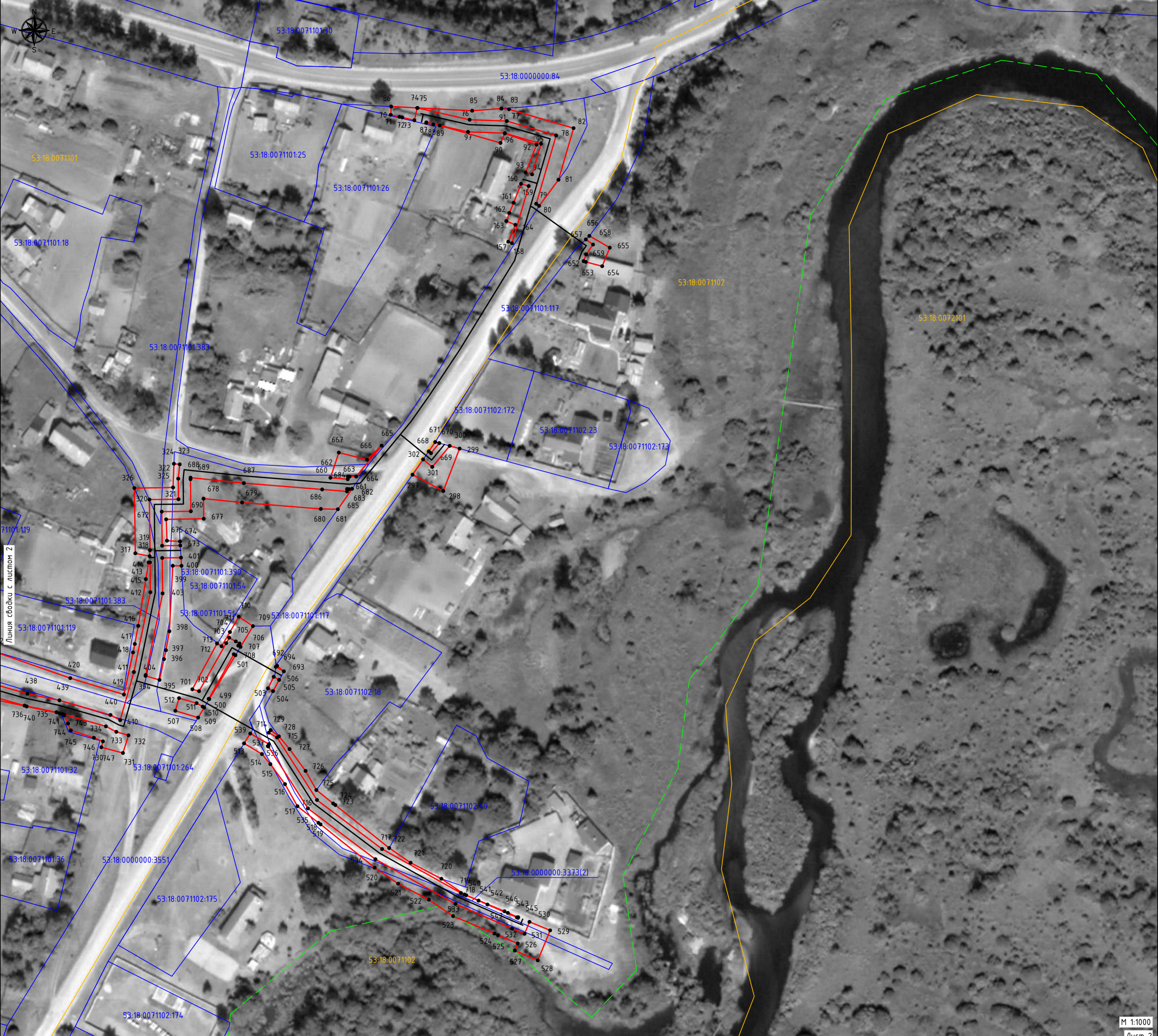
СХЕМА РАСПОЛОЖЕНИЯ ГРАНИЦ ПУБЛИЧНОГО СЕРВИТУТА Распределительный газопровод д. Горка