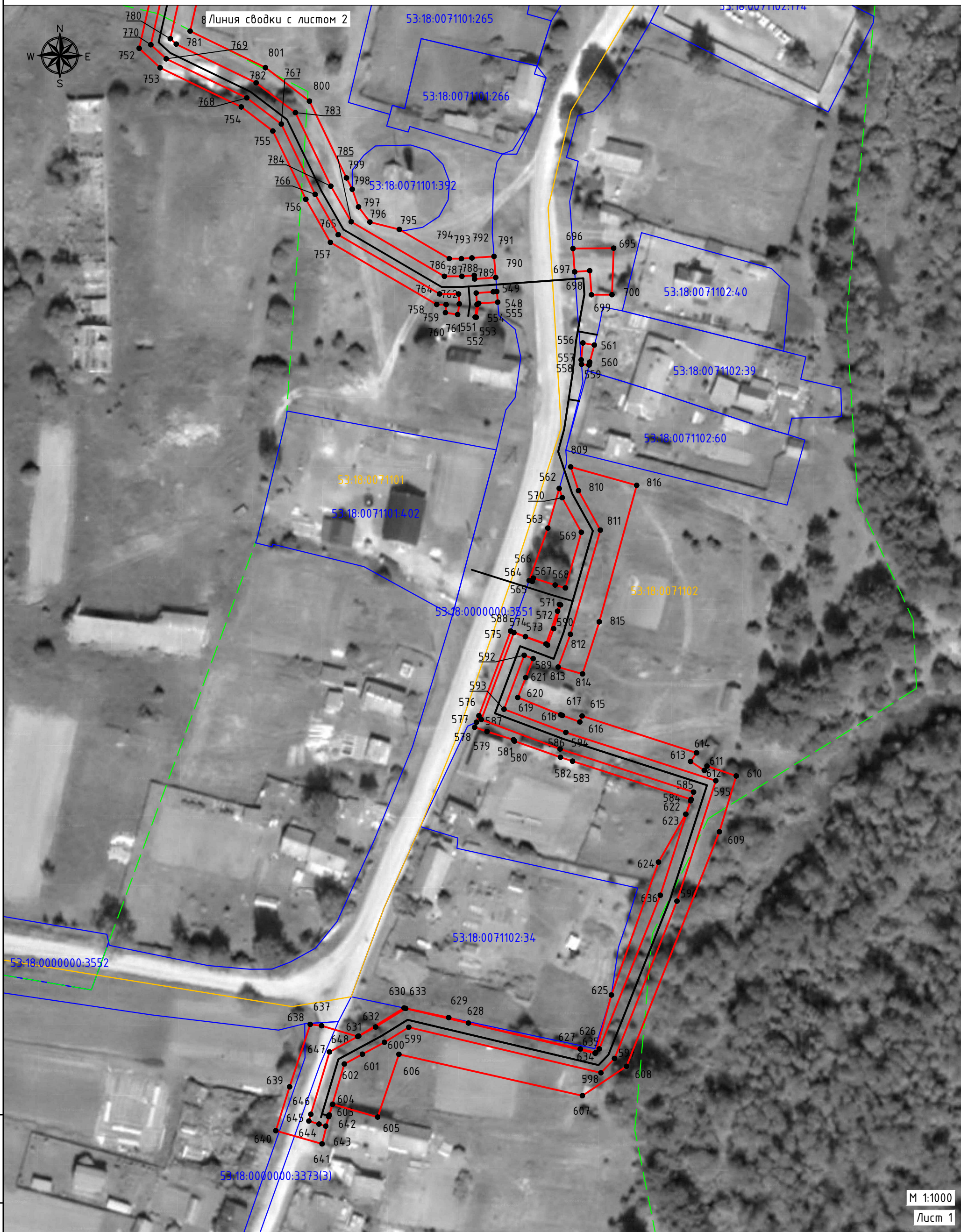
СХЕМА РАСПОЛОЖЕНИЯ ГРАНИЦ ПУБЛИЧНОГО СЕРВИТУТА Распределительный газопровод д. Горка